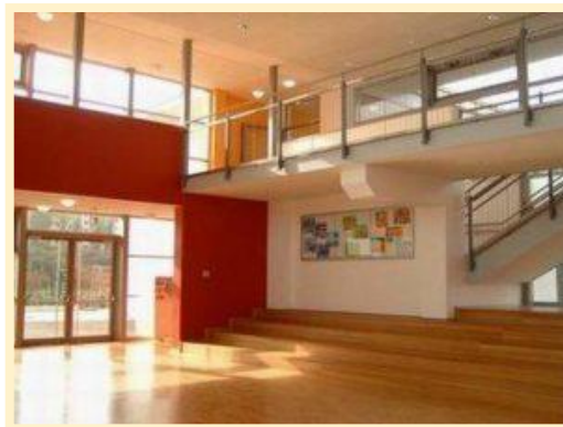
Unsere Jahnschule – Ein Ort für alle!

Eine modern ausgerichtete Schule braucht pädagogische Konzepte, gute Lehrer*innen, Erzieher*innen und einen fruchtbaren Lern- und Lebensraum an der Schule. Eine gute Zusammenarbeit aller Gremien und Beteiligten, wie Schulleitung, Lehrer*innen, Erzieher*innen Schulpflegschaft, Förderverein, Eltern, Schüler*innen kann dazu beitragen, den Kindern ein möglichst optimales Umfeld zu schaffen. So werden sie mit Spaß und Neugierde lernen und sich entfalten können.